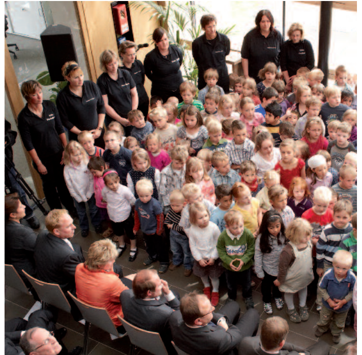
Stimmgewaltig: Der Elsflether Kinderchor sorgte für eine maritime musikalische Einlage.

Klima-, Umwelt- und Meeresschutz stellen neben der Informations- und Kommunikationstechnologie den wichtigsten Forschungsschwerpunkt des Elsflether Zentrums für Maritime Forschung dar. Innovative Technologien sollen die Schiffstransporte effizienter gestalten und klimaschädliche Emissionen mindern.