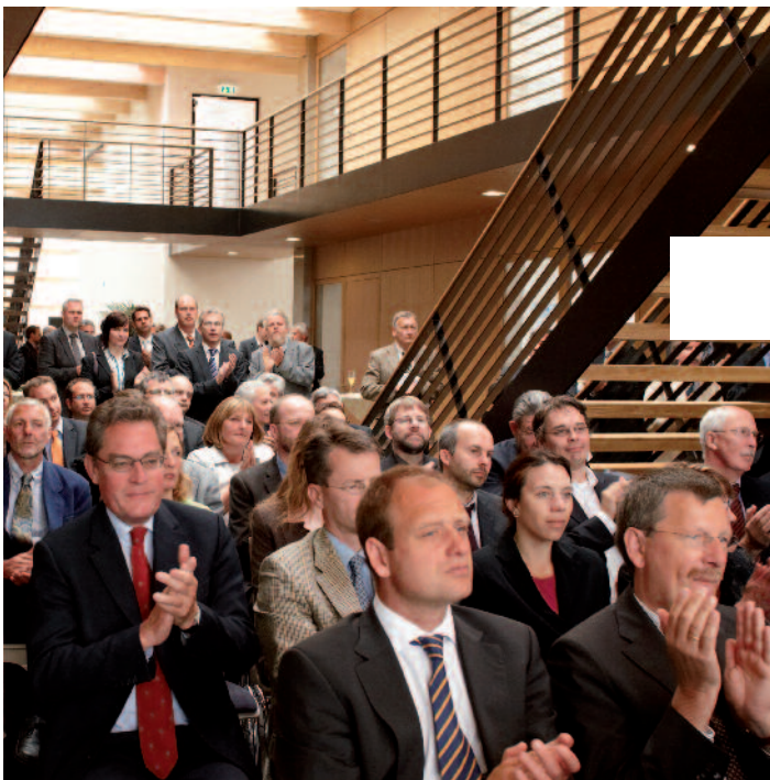
Zahlreiche Gäste aus Politik, Wirtschaft und Wissenschaft nahmen an der Eröffnung teil.

Branche. Die Eröffnungsfeier mit 150 geladenen Gästen aus der maritimen Wissenschaft, Wirtschaft und Politik war zugleich auch offizieller Start des Projekts SEMICS, das vom Bundesministerium für Bildung und Forschung gefördert wird. SEMICS zeigt, was Innovation konkret heißt: Ein ganzheitliches maritimes Informations- und Kommunikationssystem an Bord von Schwergutschiffen ist das Ziel, das papierlose Schiff die Vision.