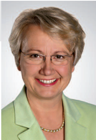
Prof. Dr. Annette Schavan, MdB, Bundesministerin für Bildung und Forschung